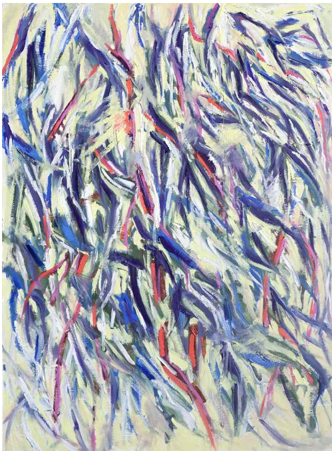
Eucalyptus 81x60cm Huile sur toile 1400€