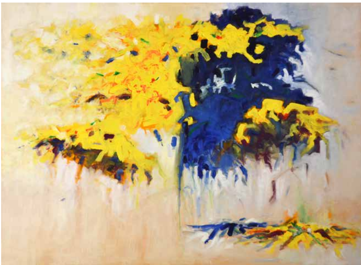
Meanwhile 73x100cm Huile sur toile 1600€