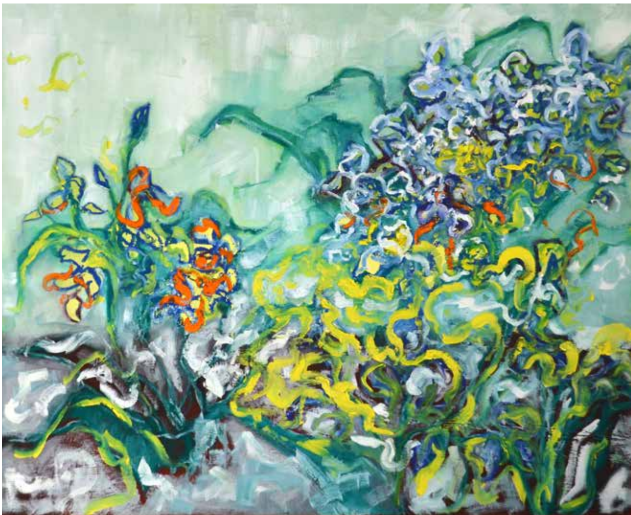
Iris sauvages 81x100cm Huile sur toile 1600€