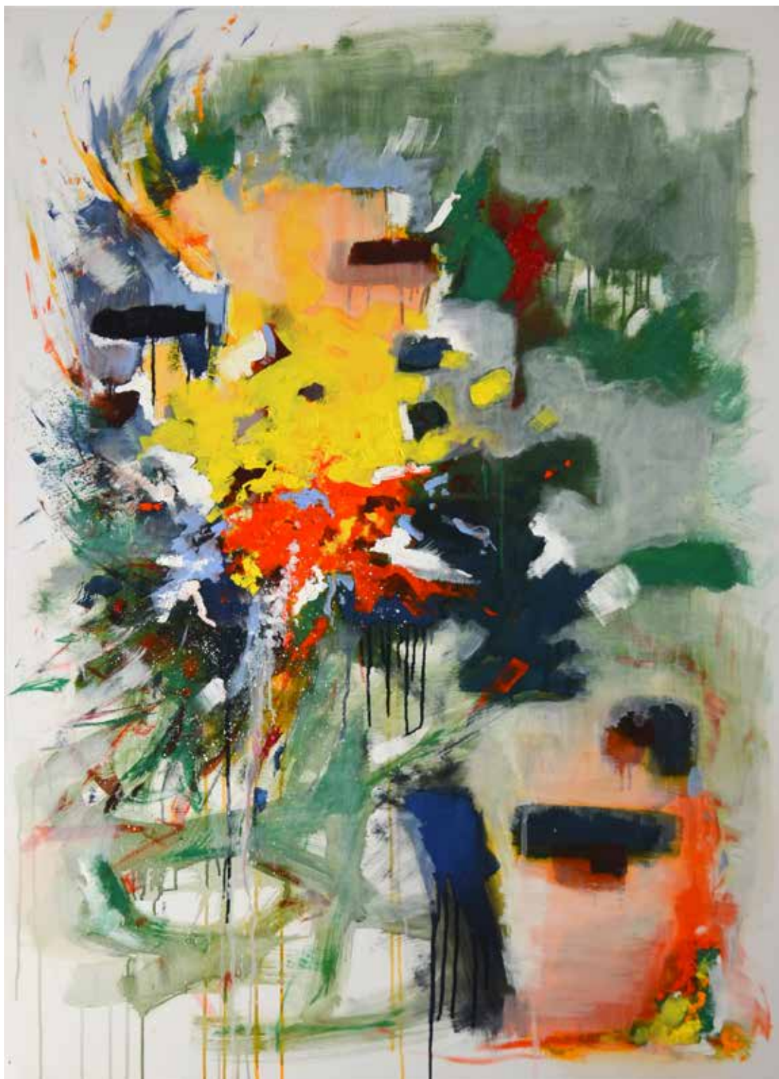
Etincelle 100x73cm Huile sur toile 1600€