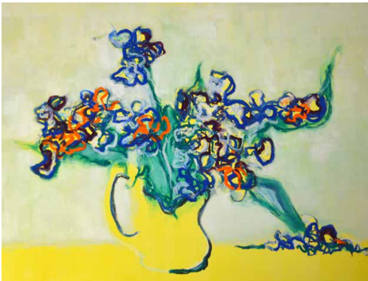
Bouquet d'iris 73x100cm Huile sur toile 1600€