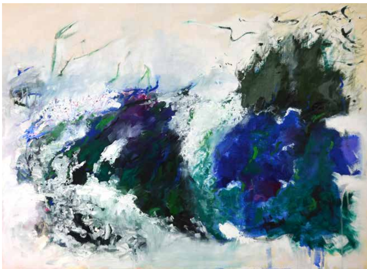
Cotentin 73x100cm Huile sur toile 1600€