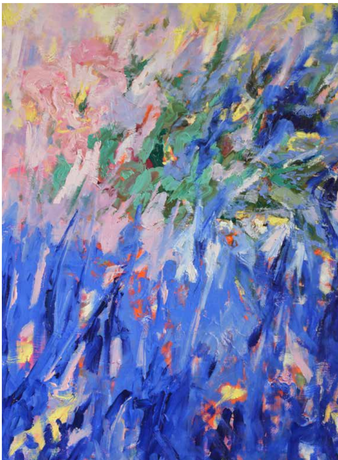
Fès 81x60cm Huile sur toile 1400€