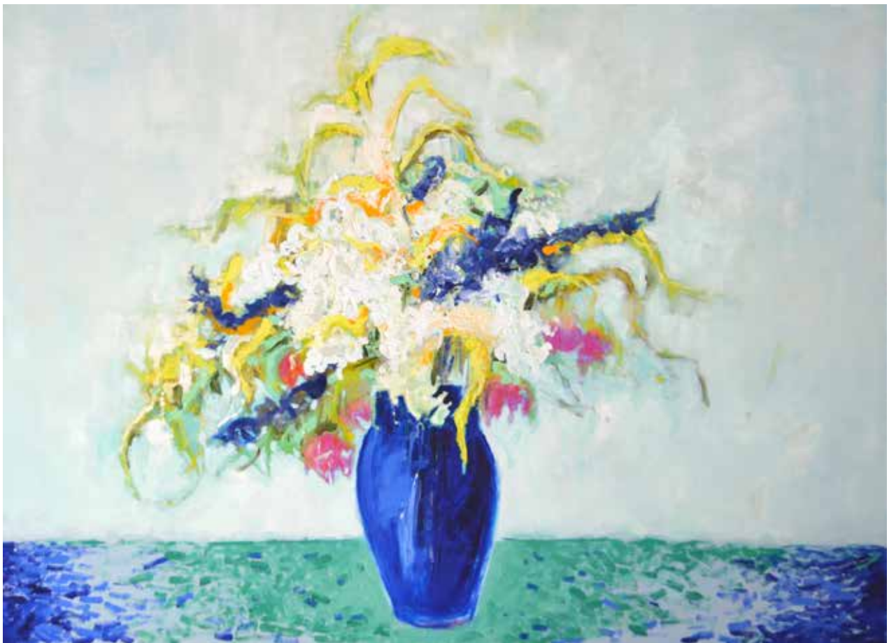
Pour Marie 73x100cm Huile sur toile 1600€