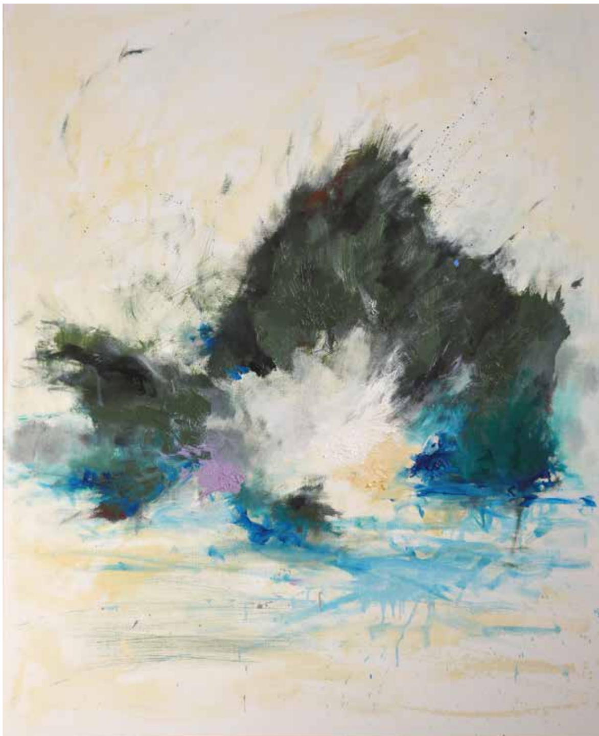
Corse 100x81cm Huile sur toile 1600€