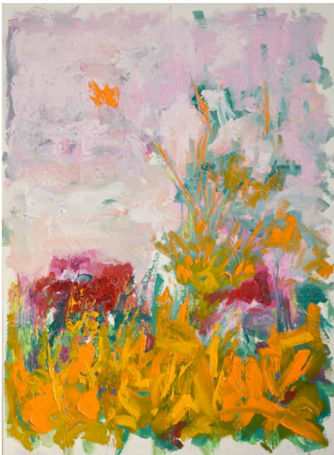
Contrepoint 81x60cm Huile sur toile 1400€