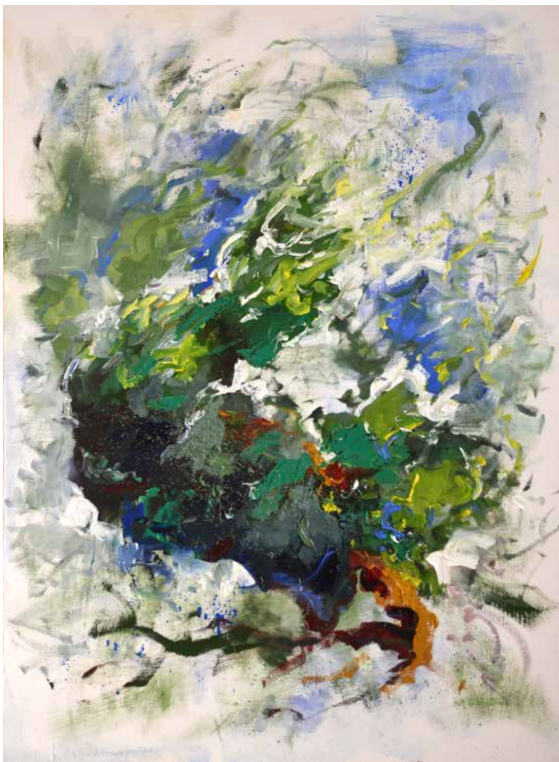
L'écume des oliviers 81x60cm Huile sur toile 1400€