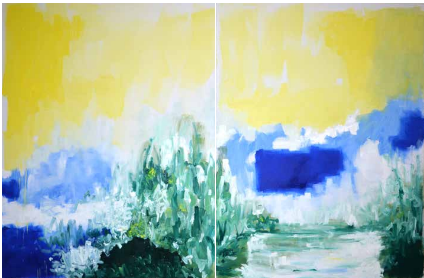
Riad 116x178cm Huile sur toile 2500€